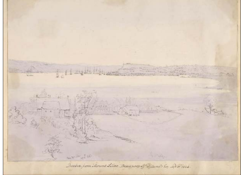
Lors de son passage à la villa Mount Lilac de Beauport, Seymour ébauche une vue de Québec, avec au premier plan des maisons et des bâtiments de ferme typiques de l'avenue Royale.

C'est à Montréal que la frégate jette l'ancre le 15 septembre. Le lendemain, alors qu'il se trouve sur l'île Sainte-Hélène, Seymour dresse le profil de Montréal, devenue en 1844 la deuxième capitale du Canada-Uni. Le 17, notre homme fait l'ascension du mont Royal d'où l'on a une vue imprenable sur la ville. Il résulte de cette excursion une vue panoramique de la cité en pleine expansion d'où pointent plusieurs clochers – dont ceux de l'église Notre-Dame –, et derrière la-