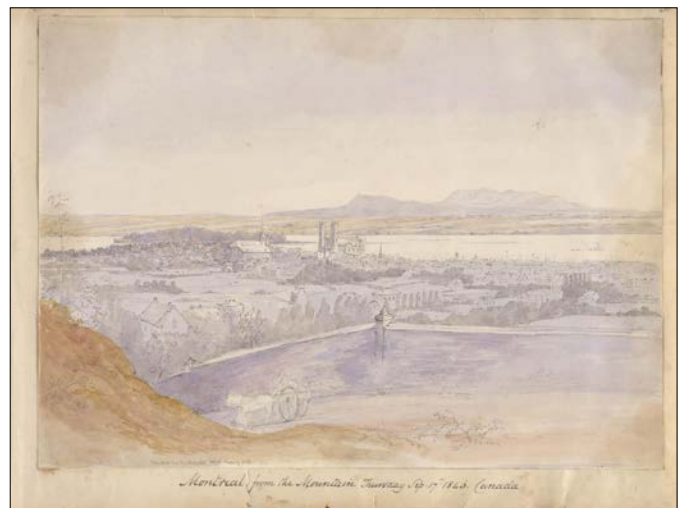
Ayant gravi le mont Royal, Seymour saisit une vue panoramique de Montréal. On distingue les clochers de l'église Notre-Dame et les Montérégiennes en arrière-plan.

Le lendemain 18 septembre, Michael Seymour est de nouveau à Québec. Il arpente le site de l'ancien parlement – où ont siégé les parlementaires du