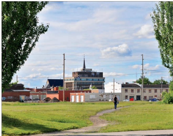
Une des solutions proposées pour revitaliser les sites industriels : aménager des sentiers piétonniers à partir des sentiers informels qui se trouvent sur les terrains vacants de l'ancienne gare de triage.