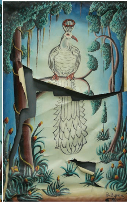
Plusieurs œuvres ont été endommagées lors du séisme du 12 janvier 2010 en Haïti. Ici, un tableau de Bourmond Byron, avant et après sa restauration.