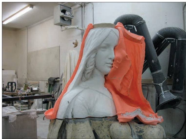
La tête et la couronne de la statue ont dû être remoulées et remplacées. Grâce à une photographie, il a été possible d'en améliorer les détails en respectant l'œuvre originale.