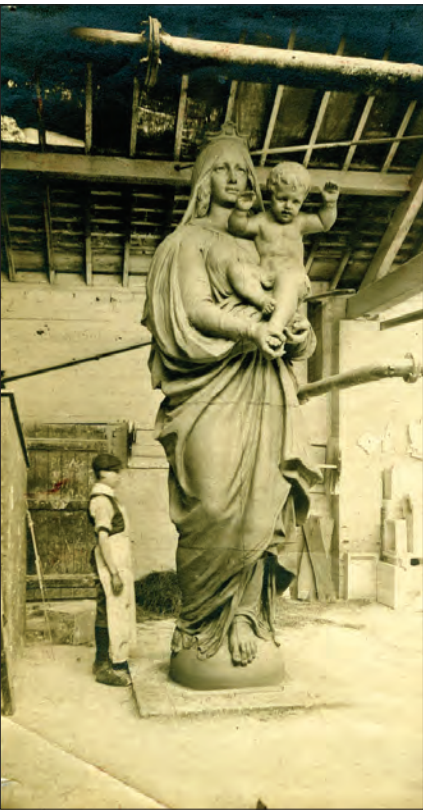
Modèle original en terre cuite fabriqué en France