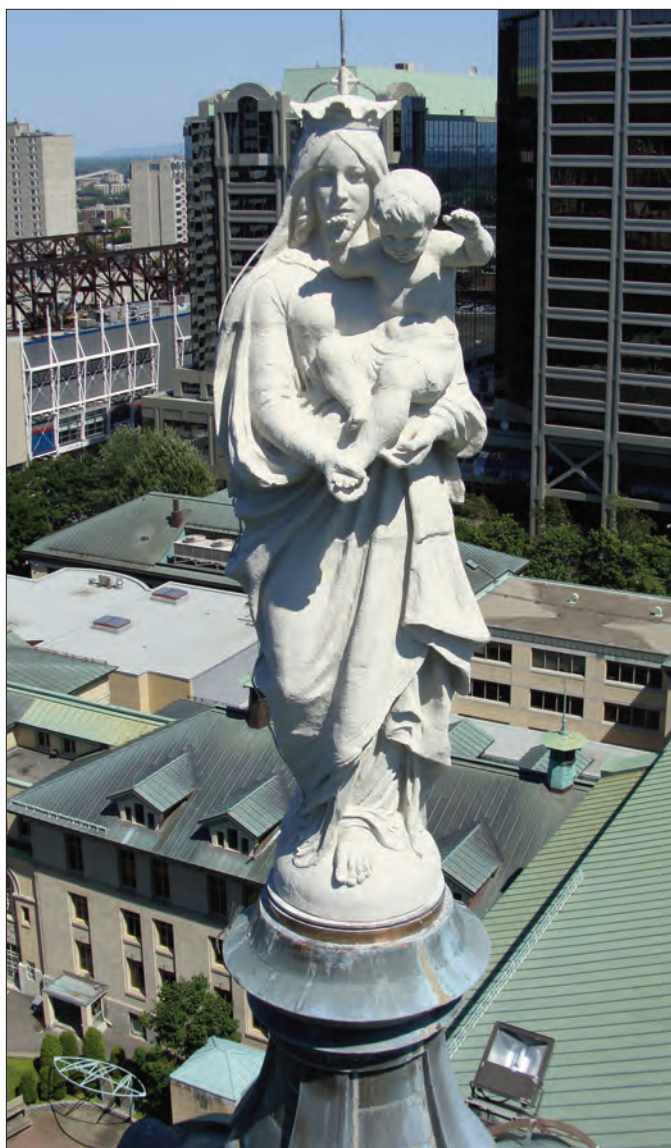
Lors de sa remise en place en 2010, la Vierge a été fixée au moyen d'un système conçu sur mesure qui permettra de la démonter facilement s'il faut la redescendre du dôme.