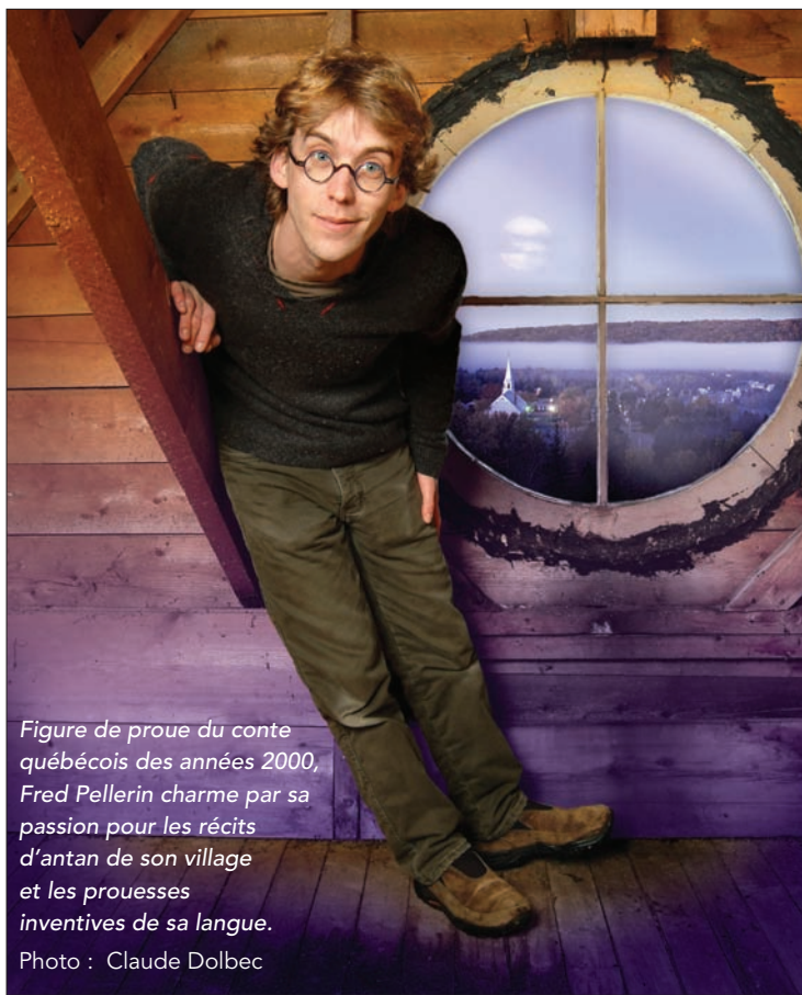
Figure de proue du conte québécois des années 2000, Fred Pellerin charme par sa passion pour les récits d'antan de son village et les prouesses inventives de sa langue.