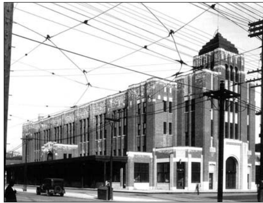
Le Marché Saint-Jacques en 1932 et en 2010

Situé au coin des rues Ontario et Amherst, le Marché Saint-Jacques a officiellement rouvert ses portes le 27 octobre, après des travaux de revitalisation de quatre millions de dollars financés par le promoteur immobilier Rosdev et la Ville de Montréal. Datant de 1871, le plus vieux des quatre grands marchés montréalais a ainsi retrouvé sa vocation d'origine : l'édifice Art déco qui l'abrite depuis 1931 accueille de nouveau une panoplie de boutiques d'alimentation. La rénovation de ce joyau historique de la métropole a été guidée par des préoccupations non seulement architecturales et patrimoniales, mais aussi environnementales ; le bâtiment est en voie d'obtenir la certification LEED du Conseil du bâtiment durable du Canada.