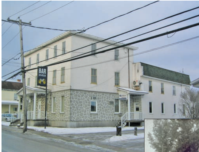
L'ancien Hôtel Bruneau de Saint-Félix-de-Valois a perdu beaucoup de cachet entre les années 1940 et 2006, notamment en raison du remplacement de son parement et de la disparition de ses galeries et de ses fenêtres de bois.