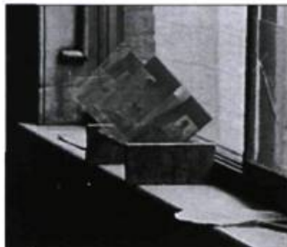
Sur la photo d'Annie McDougall, on remarquait des plaques de verre qui séchaient au bord de la fenêtre.

Photo : détail du négatif sur plaque de verre, Musée McCord (MP-1974.133.46)