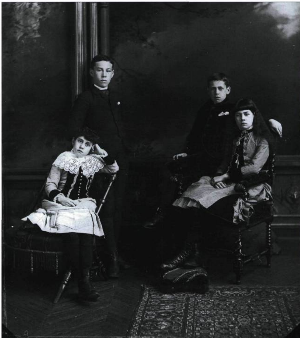
Toute la bonne société montréalaise fréquentait le studio, parfois pour faire réaliser un portrait familial ou celui des enfants.