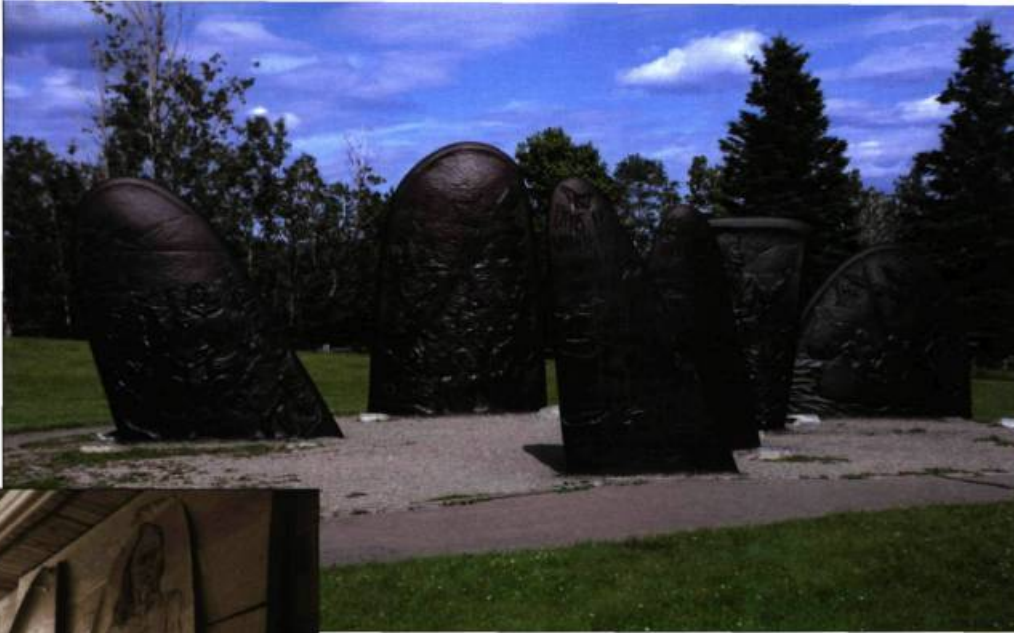
Le monument à Jacques Cartier est situé dans un parc devant le Musée de la Gaspésie.