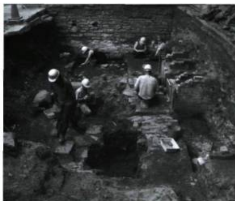
Vestiges des latrines de l'îlot des Palais