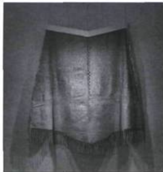
Micheline Beauchemin, Mirage blanc , 1983. Coll. MNBAQ, don de l'artiste en hommage à John R. Porter

Micheline Beauchemin est fascinée par la lumière et ses multiples nuances de même que par la nature : l'air, les marées, les eaux du fleuve, les glaces... Dans cet esprit, elle renouvelle l'art de la tapisserie et lui confère une dimension sculpturale en exploitant des matériaux comme des fils métalliques, de soie ou d'aluminium, du plexiglas, du métal, de la fibre optique. Jusqu'au 11 octobre, une dizaine d'œuvres grand format de cette artiste ainsi que quelques études et miniatures sont présentées dans l'exposition « Micheline Beauchemin.