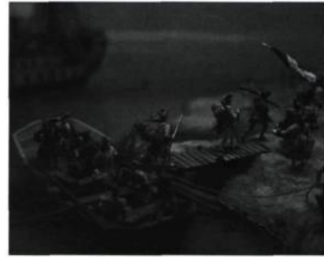
Débarquement des troupes au fort Niagara, maquette du Musée national de la marine, Paris

À l'occasion du 250 e anniversaire de la bataille des plaines d'Abraham, le Musée de la civilisation présente, jusqu'au 14 mars 2010, « 1756-1763, récit d'une guerre ». Prenant la forme d'un parcours chronologique sur fond de relations commerciales entre l'Europe et les colonies britanniques et françaises, cette exposition replace l'événement marquant du 13 septembre 1759 dans le contexte de la guerre de Sept Ans. Au gré d'artéfacts du quotidien, de lettres et de plans signés par de grands acteurs de l'affrontement, comme les généraux Wolfe et Montcalm ou le colonel James Murray, on y aborde des faits importants de ce premier conflit à ramifications mondiales, mais aussi la dimension humaine de la guerre à travers la parole de ceux qui l'ont subie. Québec. Info : 418 643-2158 ou www.mcq.org