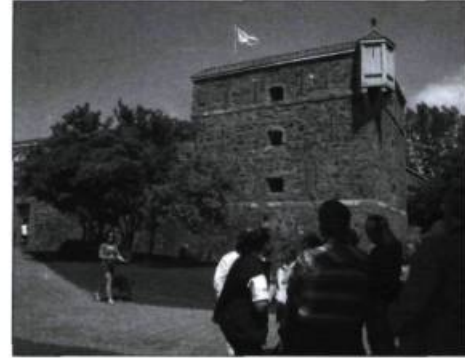
Visite au fort de Chambly