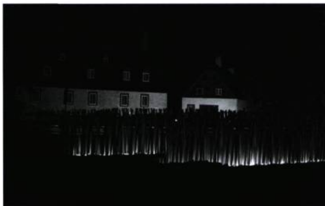
Le Pont du Moulin la nuit