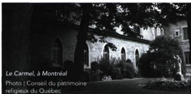
Le Carmel, à Montréal