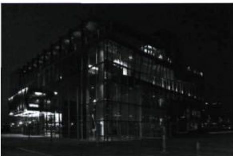
L'Espace 400 e , à Québec

de Lachute, ainsi qu'à la Commission de la capitale nationale pour la réalisation de la promenade Samuel-De Champlain, qui a impliqué la réhabilitation d'un site dégradé par des usages industriels et la mise en valeur d'un paysage culturel significatif.