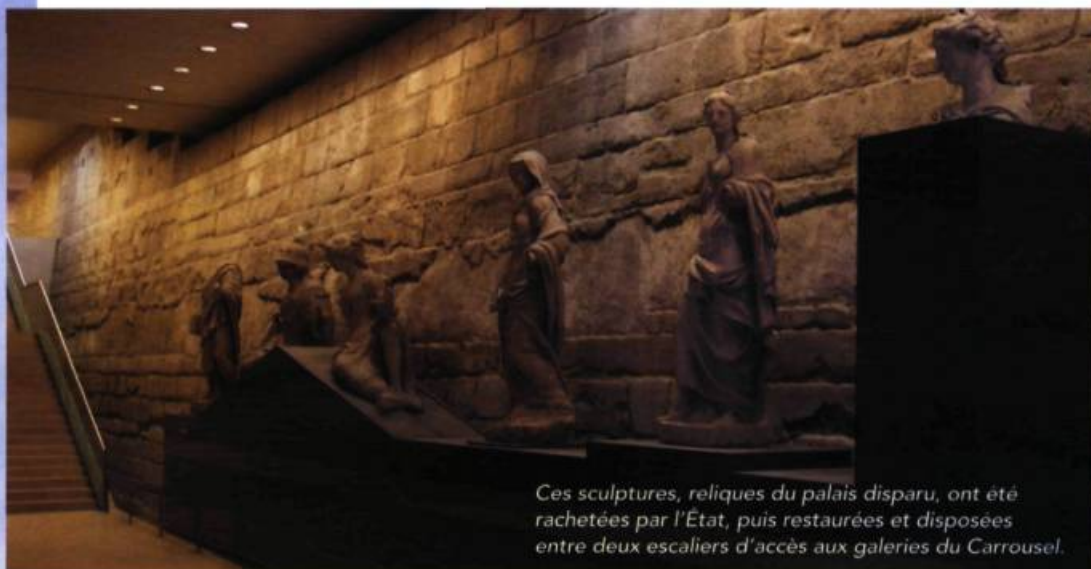
Ces sculptures, reliques du palais disparu, ont été rachetées par l'État, puis restaurées et disposées entre deux escaliers d'accès aux galeries du Carrousel.

(dont Viollet-le-Duc et Charles Garnier), les innombrables discussions et rapports parlementaires, une forte mobilisation des sociétés d'architectes et de la presse spécialisée, et l'engagement solennel d'un ministre respecté (Jules Ferry). Il s'agit du palais des Tuileries, à Paris, détruit par un incendie criminel le 23 mai 1871, lors de la sanglante Commune.