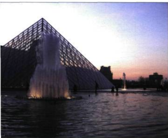
L'absence du palais des Tuileries permet à la pyramide conçue par I. M. Pei de faire écho à l'obélisque de Louxor sur la place de la Concorde.

l'incendie mais dont les façades sont désormais classées. En outre, l'insuffisance avérée des matériaux d'origine destinés au gros œuvre ne permet pas d'envisager une « copie authentique ».