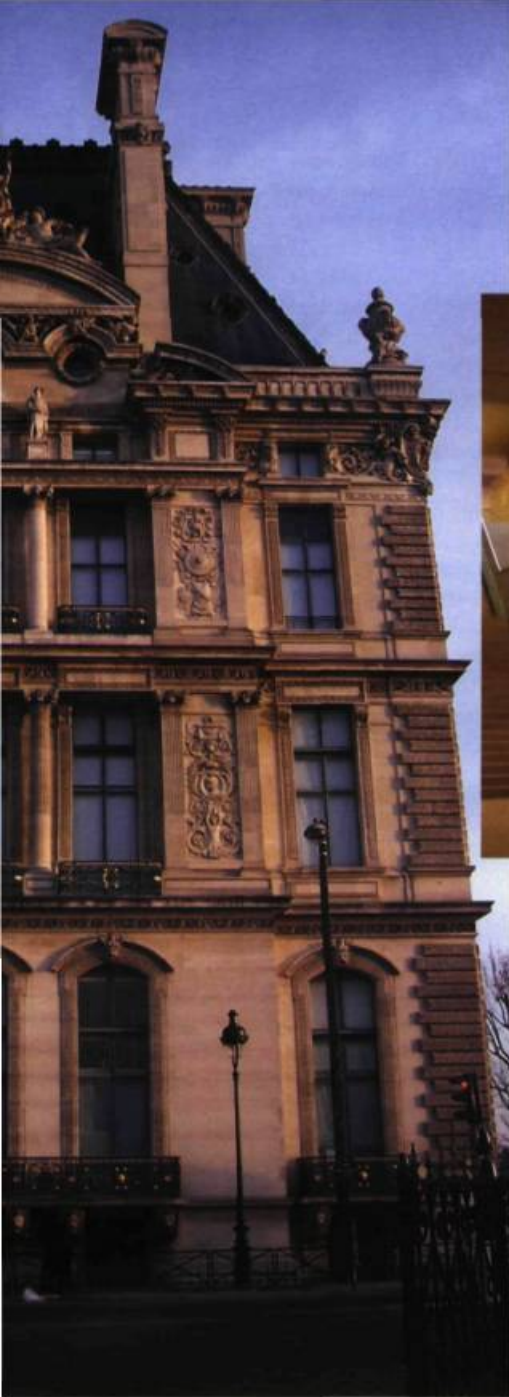
Façade occidentale du pavillon de Flore, modifié après l'arasement des Tuileries. Il formait le point de jonction sud des Tuileries et du Louvre.