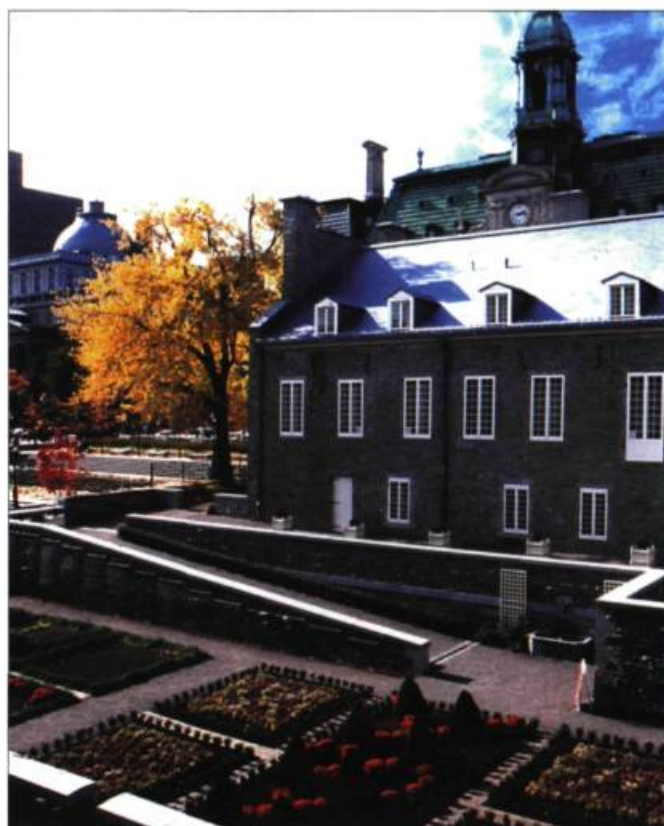
Le jardin du Gouverneur compte toutes les variétés courantes de plantes et d'arbres fruitiers qui étaient cultivées dans le jardin d'un dignitaire du XVIII e siècle.

Les participants du congrès d'ICOMOS, réunis l'automne dernier à Québec, ont bien exprimé cette vision de l'esprit du lieu dans la Déclaration de Québec. L'esprit du lieu, c'est tout ce qui « donne du sens, de la valeur, de l'émotion et du mystère au lieu ». Entre les murs du château, l'esprit du lieu conserve tout particulièrement la mémoire de la famille de Ramezay, pierre d'assise de l'histoire de cet édifice. « L'esprit construit le lieu et, en même temps, le lieu investit et structure l'esprit », lit-on encore dans la Déclaration de Québec. L'évolution du