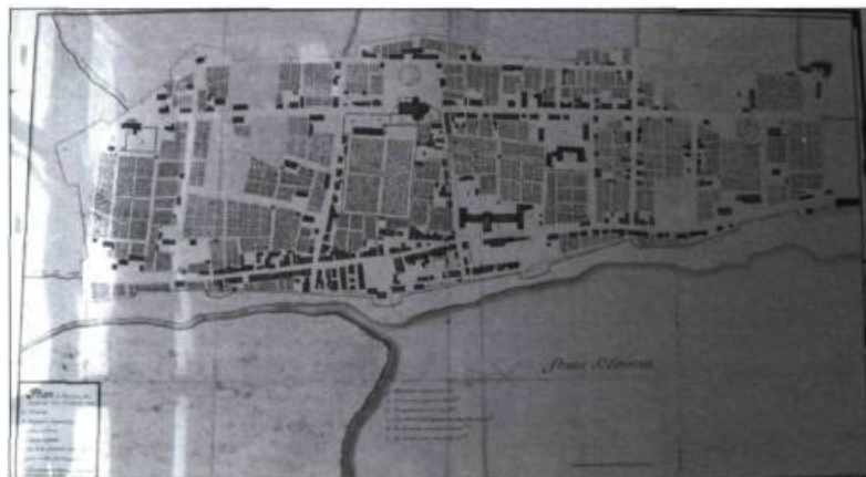
Plan de la ville de Montréal relevé en 1704 par Jacques Levasseur de Néré.

L'examen attentif du plan a aussi permis de corriger certaines perceptions : jusque-là, on croyait qu'il y avait seulement un potager, que le jardin était uniquement utilitaire et que les aménagements étaient peu variés. Il a aussi permis de découvrir des éléments jusqu'alors passés inaperçus. Tout d'abord, la petite structure quadrillée à l'extrémité de l'église, qui semble un cabinet de verdure constitué d'un treillis de forme géométrique différent des habituels berceaux. Cette structure est très significative dans le langage des jardins. Elle fait corps avec l'allée plantée,