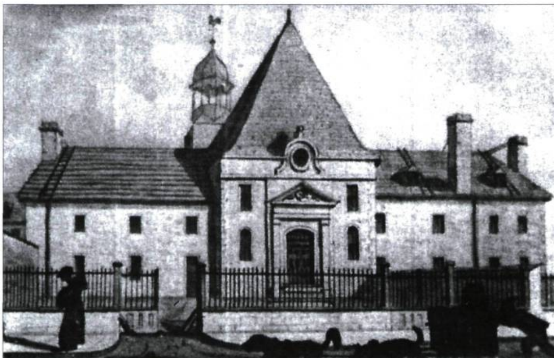
Séminaire des Récollets, Montréal, sépia de John Drake, 1828. Ill. : tirée de L'Architecture en Nouvelle-France , Gérard Morisset, 1980

mur, une pratique courante à l'époque. D'autres éléments construits étaient également présents : à l'intérieur du site, un muret ceinturait les carrés aménagés dans la partie sud; deux escaliers complétaient cette construction. Des allées de circulation ont été identifiées dans l'axe est-ouest ainsi que deux alignements parallèles de pierres taillées (secteur nord-est). Ces derniers pourraient constituer un trottoir menant à la rue Sainte-Anne ou une partie d'un aménagement paysager. Le rapport de fouilles mentionne la dénivellation du terrain dans l'axe sud-nord, ce qui expliquerait l'aménagement des escaliers.