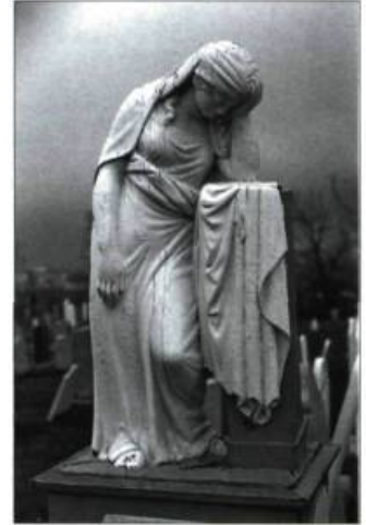
La Pleureuse, œuvre du sculpteur Jean-Baptiste Côté.

Avec leurs lieux naturels, leurs monuments, leurs sites, leurs sculptures et les rites dont ils sont le théâtre, les cimetières sont d'une grande richesse patrimoniale. Afin de la mettre en valeur, le Musée du Château Dufresne offre l'exposition « Le Patrimoine funéraire, un héritage pour les vivants », réalisée avec la collaboration de l'ethnologue Jean Simard et de son équipe. Réunissant une sélection d'objets funéraires, d'œuvres d'art sacré et de photographies de cimetières de François Brault, l'ensemble brosse un portrait de l'évolution des cimetières au Québec depuis la Nouvelle-France. On y trouve des bijoux de notre patrimoine funéraire datant du XIX e et du début du XX e siècle : des croix de fer, des sculptures religieuses, des monuments funéraires et de l'ornementation de corbillard, de même que des œuvres de Jean-Baptiste Côté, Louis-Philippe Hébert et Alfred Laliberté. Jusqu'au 30 août. Montréal. Info : 514 259-9201 ou www.chateaudufresne.com