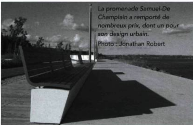
La promenade Samuel-De Champlain a remporté de nombreux prix, dont un pour son design urbain.

Depuis son inauguration à l'occasion du 400 e anniversaire de Québec, la promenade Samuel-De Champlain fait sensation. Seulement lors du 18 e concours canadien Design Exchange Awards, qui avait lieu en novembre à Toronto, elle a raflé trois prix majeurs : les premiers prix dans les catégories Design urbain, pour l'ensemble du projet, et Architecture commerciale, pour le design du quai des Cageux, ainsi que le prix d'excellence dans la catégorie Architecture de paysage pour ses jardins thématiques de la station des Quais. En outre, la promenade faisait partie des 224 finalistes du World Architecture Festival en octobre et sera en compétition dans la catégorie Tourisme durable des Grands Prix du tourisme québécois 2009.