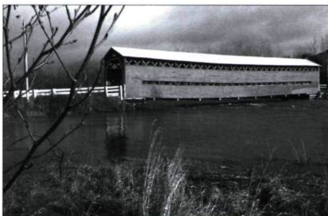
Le pont Heppell, à Causapschal, fête ses 100 ans en 2009.

Afin de diffuser les photographies des jeunes Québécois qui ont été lauréats ou ont reçu une mention au concours L'Expérience photographique du patrimoine, le Conseil des monuments et sites du Québec a réalisé quatre modules d'exposition itinérante qui circuleront dans les bibliothèques du Québec. La cinquantaine d'œuvres datant de 2002 à 2008 offrent un vaste panorama du patrimoine vu par des jeunes de 12 à 18 ans. L'exposition remporte un vif succès : le Réseau BIBLIO de la Capitale-Nationale et de Chaudière-Appalaches ainsi que le Réseau des bibliothèques publiques du Québec ont déjà emprunté ou réservé des modules. Cette nouvelle visibilité pour nos jeunes photographes permettra de sensibiliser les Québécois à leur patrimoine local et d'intéresser de nouveaux joueurs au concours d'envergure internationale. Info : 418 647-4347 ou www.cmsq.qc.ca