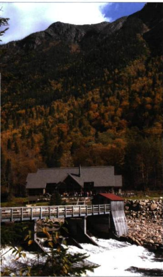
Le centre de services Le Draveur, aménagé sur le site.