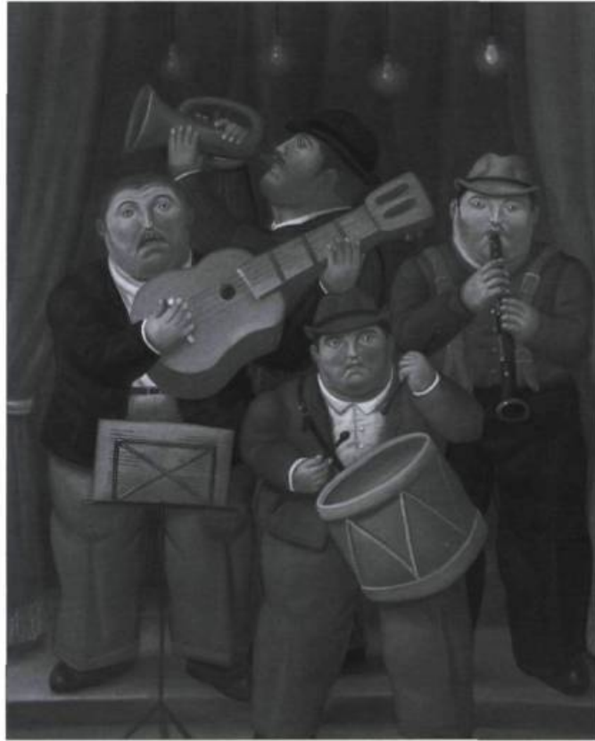
Fernando Botero, L'Orchestre, 1991. Huile sur toile, 200 x 172,1 cm. Collection particulière.

Depuis janvier dernier, le Musée national des beaux-arts du Québec est l'hôte de « L'univers baroque de Fernando Botero ». L'exposition présente une centaine des plus belles œuvres du prolifique artiste contemporain, réunissant des peintures, des dessins et des sculptures qui témoignent des différents moments de sa carrière. Né en Colombie dans les années 1930, Botero nous invite à entrer dans son univers énigmatique où l'énormité de la forme extérieure se mesure à la petitesse des détails. Cette rétrospective d'envergure orchestrée par Art Services International est présentée en exclusivité canadienne jusqu'au 22 avril. Québec. Info: 418 643-2150, 1 866 220-2150 ou www.mnba.qc.ca