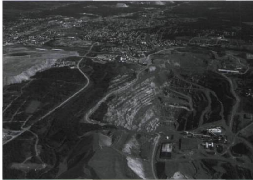
Vue aérienne des mines de Thetford Mines. L'exploitation minière dessine le paysage urbain depuis 1878.

La Ville de Thetford Mines a annoncé récemment qu'elle contribuera, conjointement avec le ministère du Tourisme, au financement de l'étude de faisabilité pour la mise en valeur du patrimoine minier et industriel de la mine King Beaver Bell. La Ville a confié l'étude à Desjardins Marketing Stratégique. Elle souhaite développer un produit touristique distinctif basé sur les empreintes que l'exploitation du chrysotile a laissées sur le paysage depuis 1878. Le mandat d'évaluer les opportunités du projet de mise en valeur touristique et de procéder à d'éventuelles recommandations est actuellement entre les mains de la Corporation du patrimoine minier.