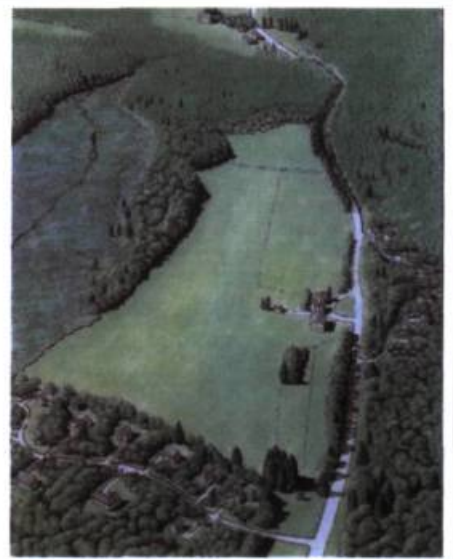
Figure C Vue aérienne du site après un projet créatif de développement

Certains outils existent pour favoriser une implantation résidentielle harmonieuse, notamment en milieu rural. Appréciés pour leur souplesse, les PAE et les PIIA en sont.