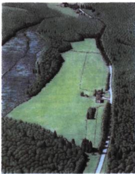
Figure A Vue aérienne du site avant le développement