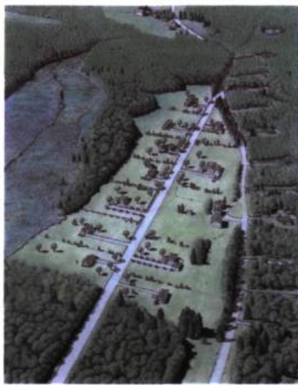
Figure B Vue aérienne du site après un projet de développement conventionnel