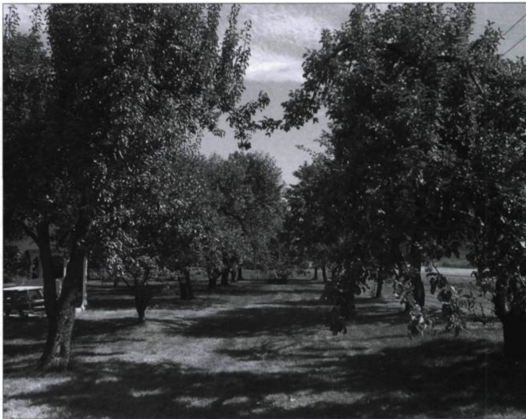
Âgé de plus de 80 ans, ce verger familial de la Côte-du-Sud rappelle l'importante tradition fruitière qui a marqué la région pendant deux siècles et demi.

À partir des résultats obtenus à l'automne 2005, certaines variétés ont été sélectionnées afin d'être introduites dans le verger conservatoire, selon des critères tels que les qualités physiques (rusticité, saveur), l'ancienneté et la fréquence de la présence dans la région. Ce printemps, des scions ont été greffés pour former la relève d'un patrimoine génétique d'une valeur inestimable. Les pommes Fameuse, Saint-Laurent d'hiver et Duchesse, les prunes Damas bleue et Reine-Claude de Montmorency ainsi que les poires Beauté flamande et Favorite de Clapp, pour ne