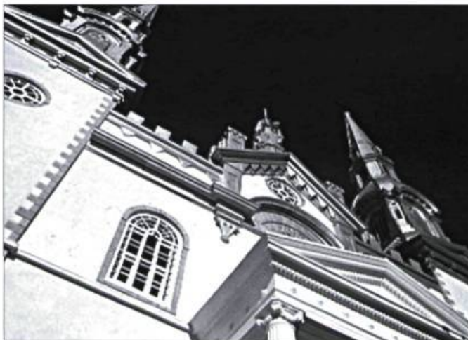
Église de Lotbinière.

Le CMSQ déplore que l'avenir de l'architecture religieuse moderne n'ait pas été abordé lors de ce colloque. Cette architecture témoigne d'une créativité locale et régionale exceptionnelle dans l'histoire du Québec. Pourtant, elle est méconnue et menacée. Le CMSQ applaudit toutefois la tenue de cette rencontre qui a fait connaître différentes stratégies et expériences de réutilisation. Une nouvelle culture se profile pour donner à notre patrimoine religieux de nouvelles fonctions prolongeant la mission sociale et culturelle de l'Église.