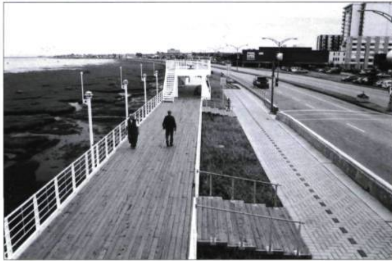
La promenade de la Mer sert de lien entre les tronçons est et ouest de la Route verte.

L'achalandage et les commentaires reçus confirment le grand succès de cette réalisation, rendue possible grâce à une étroite collaboration entre plusieurs personnes et intervenants, notamment le personnel de la Ville, le ministère des Transports du Québec, qui a fait les plans du mur et l'a ensuite conçu, la firme Pluram urbatique, qui a réalisé le concept et le plan d'amé-