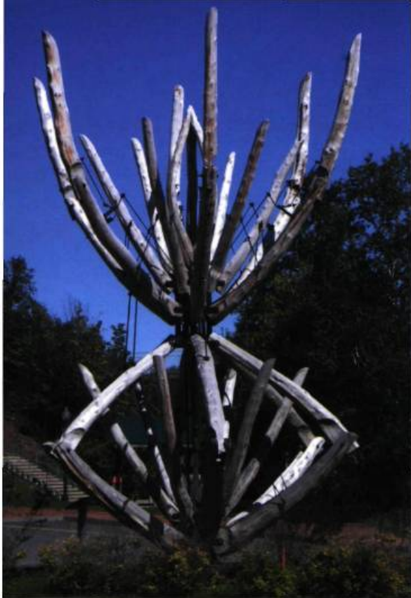
Solstice, une œuvre de Gaétan Blanchet, un artiste de la région, rappelle par ses matériaux et sa forme le passé industriel du parc des Chutes, qui comptait d'importants moulins à scie.

atteint un corpus d'une trentaine de sculptures, permettant de réaliser diverses activités d'interprétation des œuvres dans les parcs urbains, les espaces verts et les lieux publics de la ville. Un constant souci d'intégration des œuvres au milieu permet un nouveau dialogue avec la ville, dans ses significations historiques comme dans son identité culturelle et sociale. L'originalité de ce projet lui a d'ailleurs valu le Prix aménagement de la coalition Les Arts et la Ville en 2004.