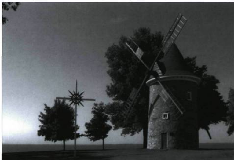
Le moulin à vent de Pointe-Claire et la croix des Missions.