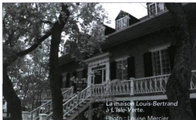
La maison Louis-Bertrand à L'Isle-Verte.

En présence de nombreux membres de la famille Bertrand-Michaud et de dignitaires, une plaque commémorative a été dévoilée le 2 juin dernier sur le site de la maison Louis-Bertrand à L'Isle-Verte, dans le Bas-Saint-Laurent. Cette reconnaissance de Parcs Canada et de la Commission des lieux et monuments historiques du Canada vient souligner l'intérêt patrimonial de cette demeure datant de 1853, dont l'intégrité a été très bien préservée et qui constitue un exemple remarquable de maison québécoise d'inspiration néoclassique. Conservée amoureusement par quatre générations de Bertrand-Michaud, la maison Louis-Bertrand possède l'un des plus beaux intérieurs anciens du Québec. À l'heure actuelle, le milieu se mobilise afin de soutenir les propriétaires et d'assurer la restauration et la mise en valeur de la demeure.