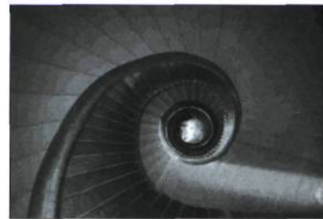
L'interminable escalier de l'église Saint-Dominique.

L'exposition internationale qui clôture le concours 2005 de « L'expérience photographique du patrimoine » est présentée jusqu'au 20 novembre au Centre national d'exposition à Saguenay, grâce à la collaboration de l'Institut des arts au Saguenay. Pour cette édition du concours, le Conseil des monuments et sites du Québec a reçu 1000 inscriptions provenant des quatre coins de la province. Au final, 600 photographies ont été soumises. Du nombre, le jury a sélectionné sept photos lauréates et a décerné une mention. Ces jeunes gagnants ont entre 13 et 18 ans et proposent un regard intelligent et sensible sur le patrimoine de leur milieu. L'exposition internationale présente les 160 photos lauréates des 27 pays partici-