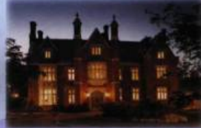
Manoir Rouville-Campbell