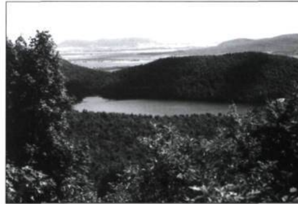
Dans les hauteurs du mont Saint-Hilaire, le lac Hertel. Autrefois, source d'inspiration pour Ozias Leduc, ce lac fait partie aujourd'hui de la réserve mondiale de la biosphère.