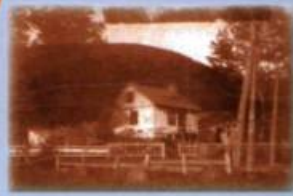
Maison natale d'Ozias Leduc