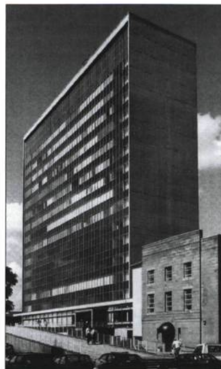
Le complexe Lanark County Buildings, à Hamilton en Écosse, a été conçu par l'architecte D. G. Bannerman entre 1958 et 1964.

Le choix des bâtiments et sites est d'abord basé sur des critères de sélection proches de ceux adoptés pour des œuvres plus anciennes, comme les valeurs d'unicité et