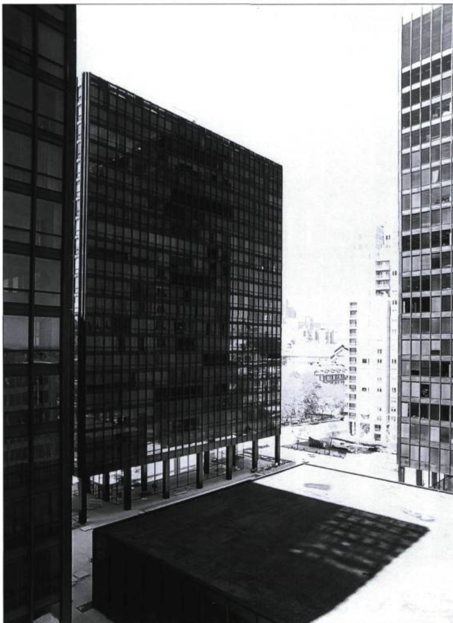
Le Westmount Square (1965) est l'œuvre de Ludwig Mies van der Rohe, en collaboration avec Greenspoon, Freedlander, Plachta et Kryton. Entre 1988 et 1990, la firme Arcop et associés a réalisé les modifications intérieures et l'architecte Jean Lemieux, les modifications extérieures.