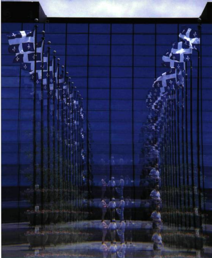
Le Pavillon du Québec à Expo 67, une réalisation des architectes Papineau, Gérin-Lajoie, LeBlanc, Durand. Le bâtiment, qui offrait un jeu de verre et de miroirs, d'opacité et de transparence, a été démoli.