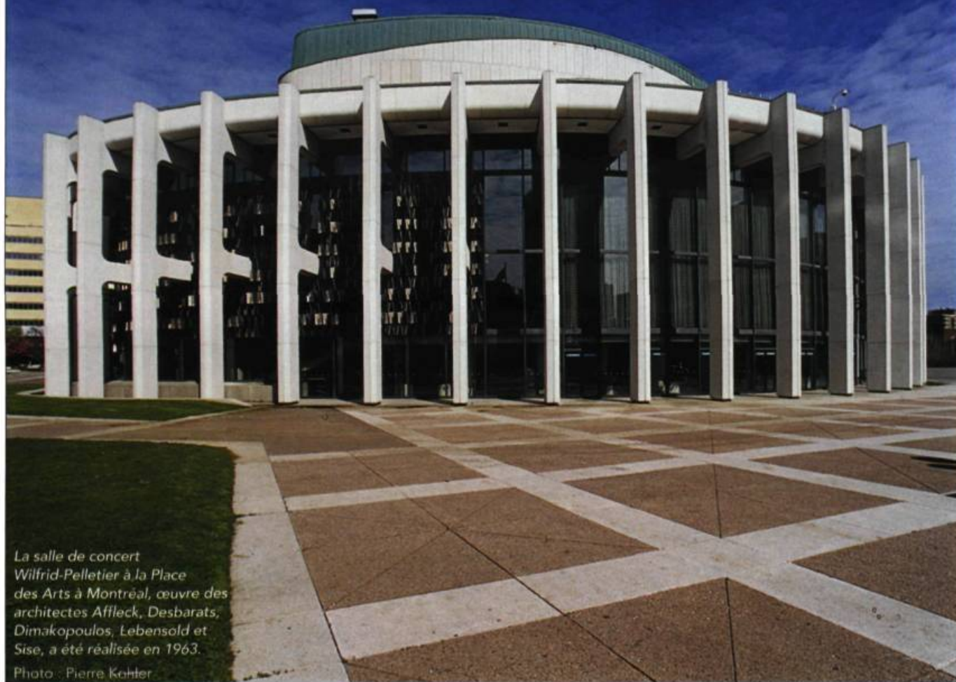
La salle de concert Wilfrid-Pelletier à la Place des Arts à Montréal, œuvre des architectes Affleck, Desbarats, Dimakopoulos, Lebensold et Sise, a été réalisée en 1963.