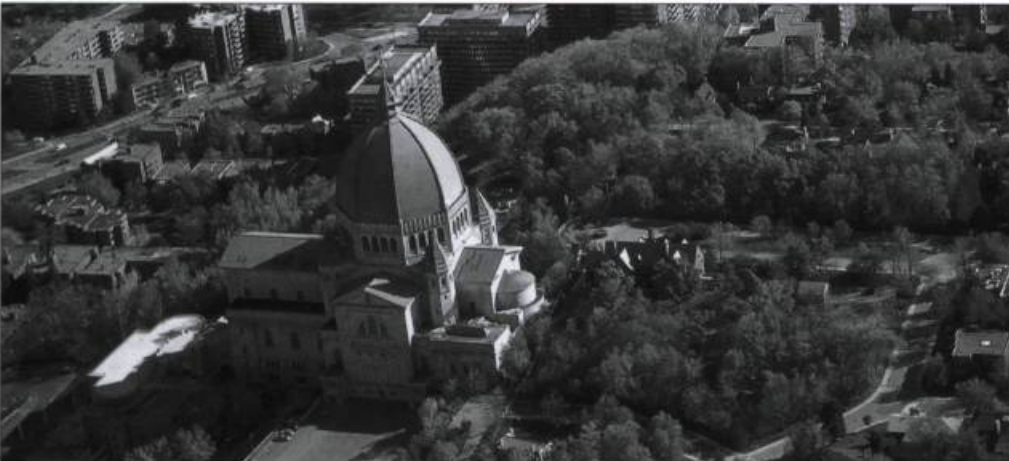
L'Oratoire Saint-Joseph. Photo : Pierre Lahoud

Dans le cadre des activités de son centenaire, l'Oratoire Saint-Joseph présente une série de conférences sur l'art et le patrimoine religieux. Elles auront lieu les mercredis 23 mars, 20 avril, 25 mai, 22 juin et 21 septembre à 19 h 30, à la salle Joseph-Olivier-Pichette de l'Oratoire. Montréal. Information : (514) 733-8211, poste 2994.