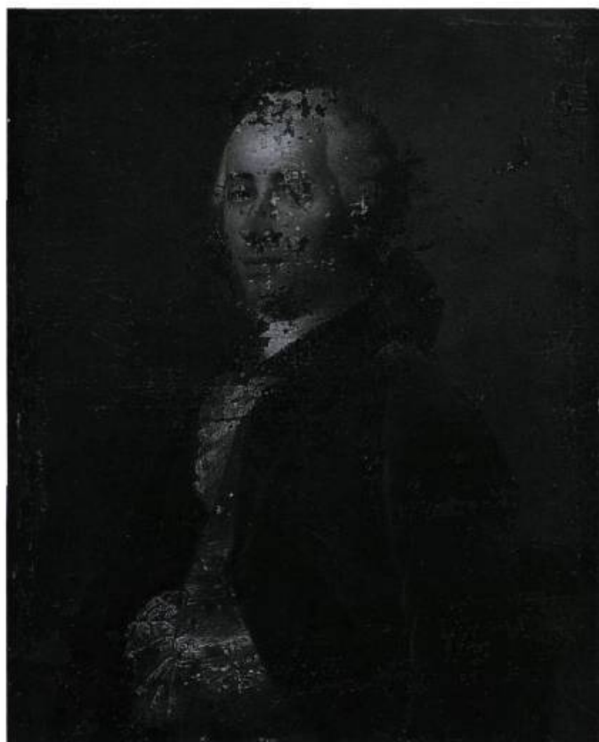
Le portrait après le retrait des couches excédentaires. Le fond rouge, visible dans les lacunes, est la couche de fond sur laquelle l'artiste a peint son œuvre.

L'origine du tableau demeure nébuleuse. On sait que d'Youville était l'époux de Marie-Marguerite Dufrost de Lajemmerais (1701-1771), fondatrice des Sœurs Grises et première directrice de l'Hôpital général de Montréal. En 1899, la Société d'archéologie et de numismatique de Montréal, dont la collection fait aujourd'hui