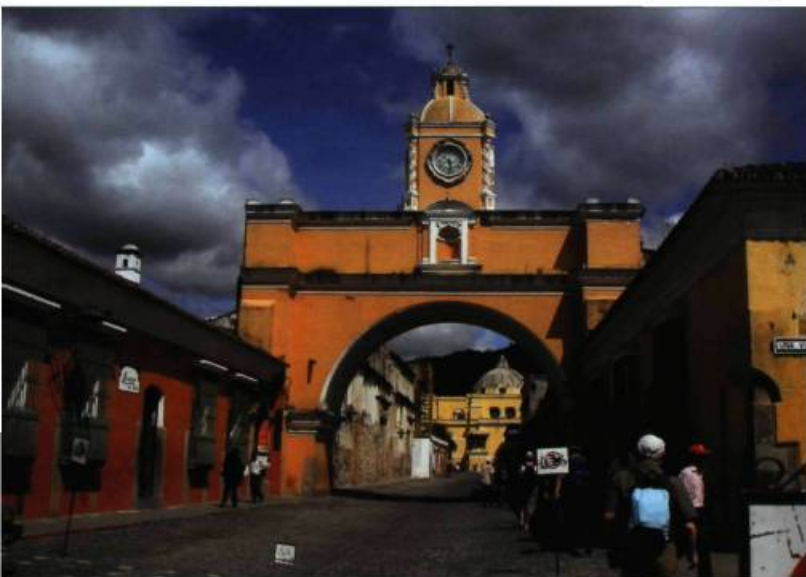
Point de repère de la ville, l'arc de Santa Catalina est la seule partie visible du couvent de Santa Catalina fondé en 1609.

des autorités, la fontaine ruiselante d'eau balayée par un éclairage architectural. Telle une perle sertie dans le bijou baroque qu'est Antigua, la fontaine des Sirènes est désormais reconnue comme un « sanctuaire de paix et de dignité » par la population guatémaltèque. L'impact est certes considérable sur l'apparence de la Plaza Mayor. Mais plus encore, ce projet encourage la formation sociale et l'éducation civique des jeunes de cette ville.