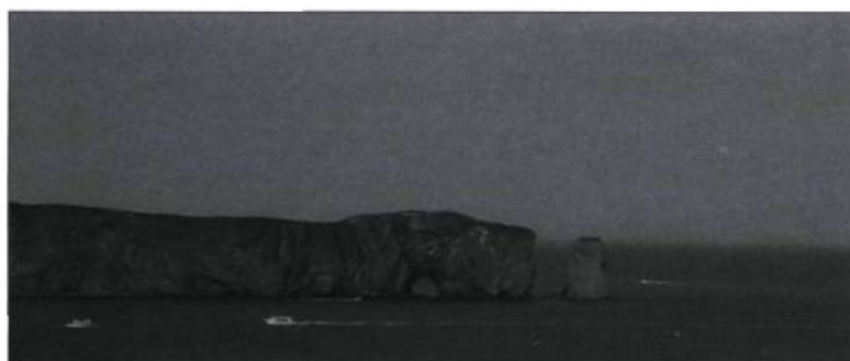
Le Québec et la Suède, deux contrées où les paysages maritimes sont omniprésents. En haut, la réserve naturelle de Ramsvikslandet.