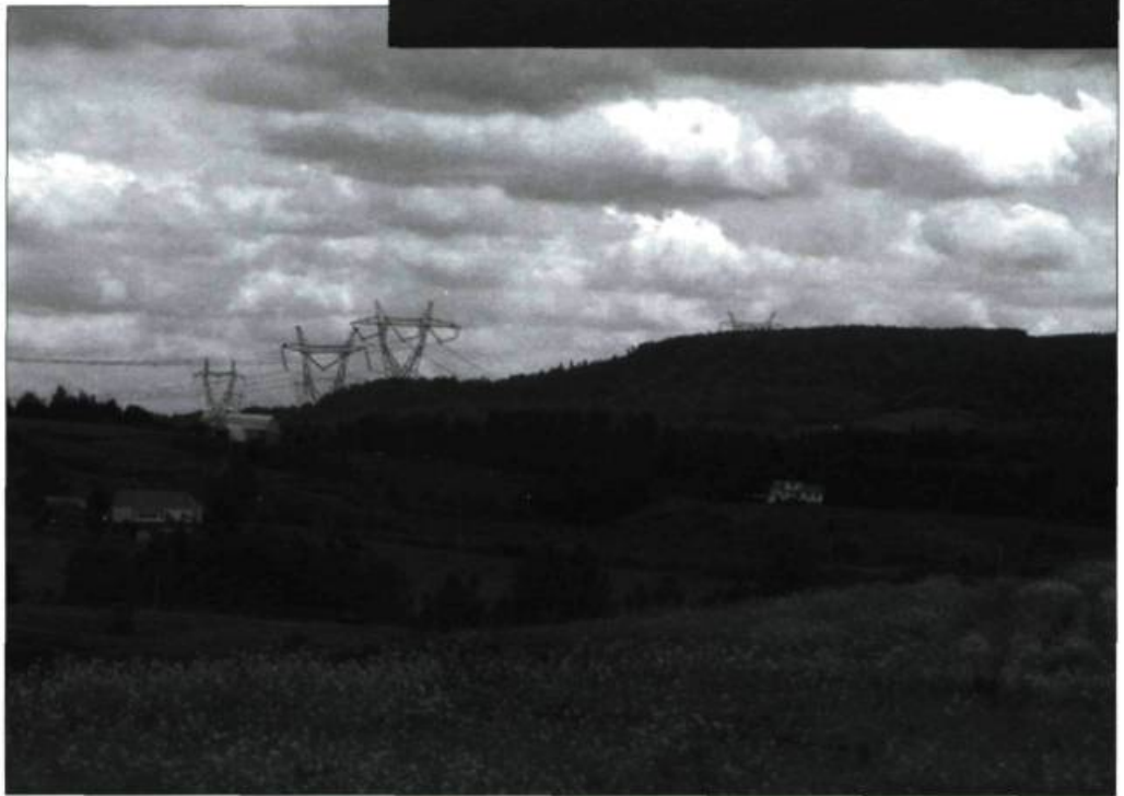
Éoliennes en milieu rural en Scanie et pylônes dans le Centre-du-Québec. Deux visages du transport d'énergie.