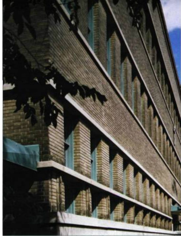
L'école Notre-Dame-de-la-Défense, située rue Henri-Julien à Montréal, est l'œuvre de l'architecte Eugène Larose. La composition de ce bâtiment construit en 1933 fait abstraction de l'ornement historiciste et franchit ainsi l'étape de la modernité.

■ Jacques Lachapelle est professeur agrégé à l'École d'architecture de l'Université de Montréal.