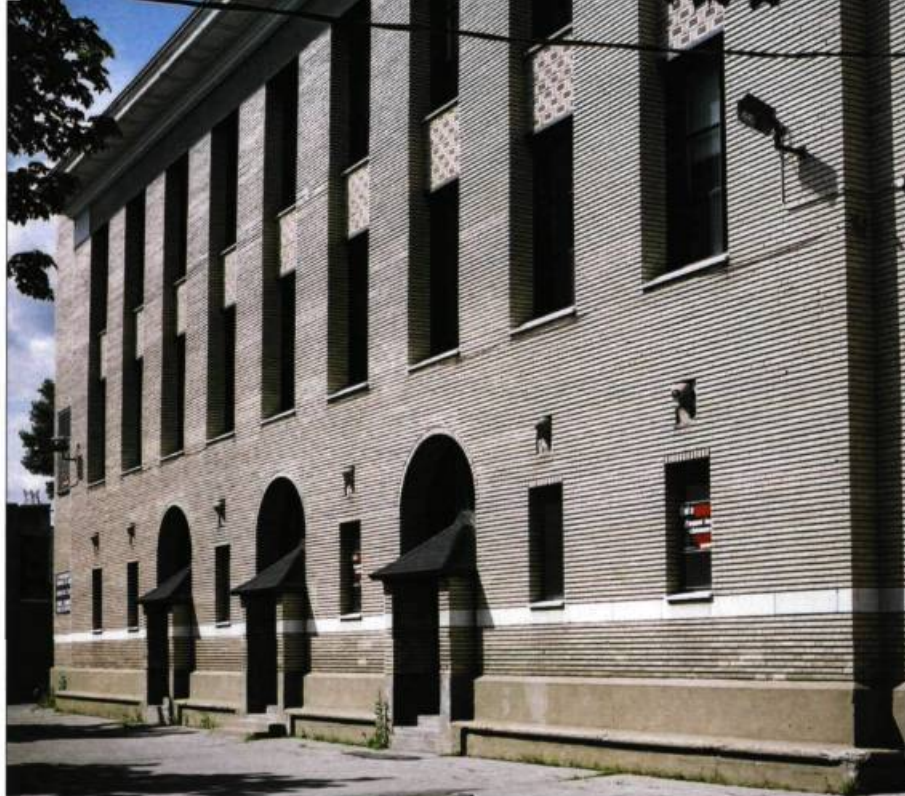
Construite en 1925, l'ancienne école Sainte-Julienne-Falconieri, à Montréal, est de l'architecte Ernest Cormier. La composition de la façade procède d'une succession de travées uniformes qui rappellent l'image du péristyle.

des préceptes classiques. Sa monumentalité caractéristique est justifiée par une idéologie selon laquelle les commandes publiques doivent contribuer à l'embellissement urbain. Après la Grande Guerre, peut-être lors de sa brève collaboration avec Marchand, Cormier propose, avec l'école Saint-Arsène, une solution où ce n'est pas le style mais la composition qui importe. Le rez-de-chaussée, qui n'est plus ici le soubassement d'une série de pilastres, est percé d'une triple arcade qui éclaire généreusement la grande salle et indique sa position centrale. La subdivision de l'élévation dévoile également le plan des classes aux étages. La façade devient ainsi le portrait de l'intérieur plu-