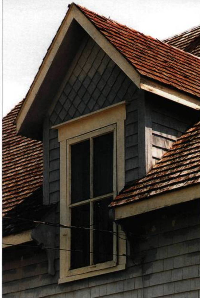
Ici, une lucarne à fenêtre pendante interrompant l'avant-toit avec ailerons et bardeaux décoratifs.