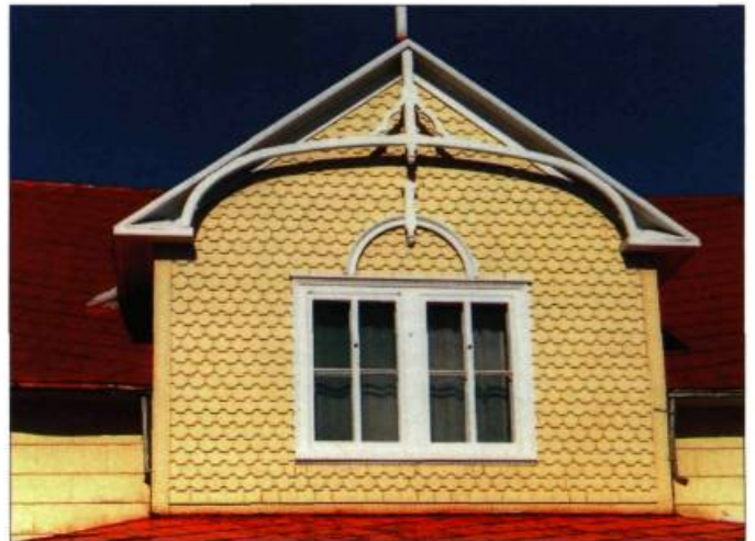
Non seulement cette grande lucarne à double fenêtre et fermette apporte beaucoup de lumière à l'intérieur, mais elle offre un espace d'occupation plus grand à l'étage.

Des éléments de tôle rouillés en surface demandent un bon ponçage, puis la pose d'un apprêt antirouille et de deux couches de peinture pour métal. Si la tôle est percée,