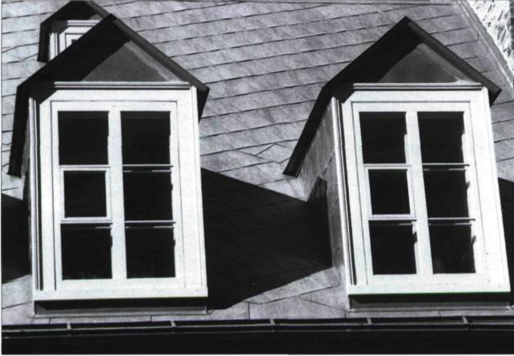
Lucarnes à fronton-pignon dont les jouées et la toiture sont revêtues de tôle à la canadienne.