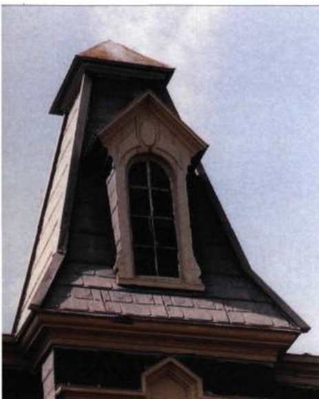
Cette lucarne à pignon avec fenêtre cintrée décore joliment l'avant-corps du bâtiment.

La plupart des lucarnes sont à deux versants, soit avec un devant triangulaire qui forme pignon, soit à croupe, c'est-à-dire avec le pignon coupé ou tronqué. La lucarne à fronton occupe de façon majestueuse le centre de la façade; ses dimensions en font un élément structurant de la toiture. La lucarne à fermette, typique