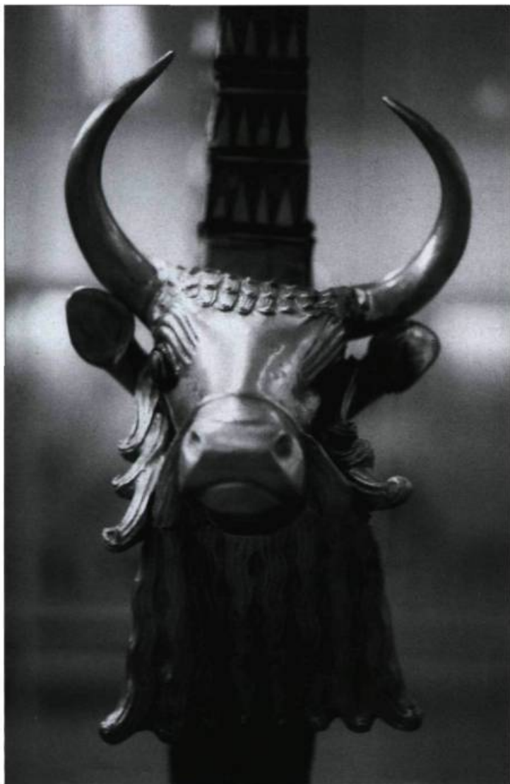
Une tête de taureau en or de l'époque de la civilisation sumérienne provenant des tombes royales d'Ur en Irak.

Cofondateur du Comité international du Bouclier Bleu (voir encadré), l'ICOMOS a mené une campagne pour inviter les États à reconnaître et à appliquer en Irak la Convention sur la protection des biens culturels en temps de conflit armé (1954) et la Convention du patrimoine mondial (1972), toutes deux signées par le Canada. À titre de participant aux rencontres d'experts sur le patrimoine irakien convoquées par l'UNESCO, l'ICOMOS a fait valoir qu'il fallait se préoccuper également des bâtiments, des ensembles urbains ou ruraux et des sites archéologiques d'où proviennent les spectaculaires collections muséales. En tant qu'association de collègues présents dans 120 pays, l'ICOMOS a insisté