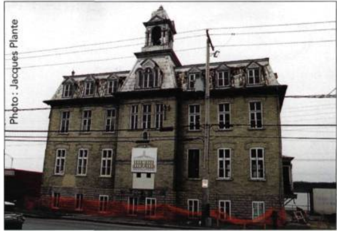
Les travaux de restauration ont peu modifié l'enveloppe extérieure du Vieux-Couvent. Toutefois, la maçonnerie, la tôle et les boiseries ont exigé d'importantes réparations.