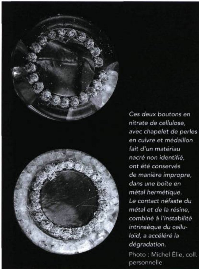
Ces deux boutons en nitrate de cellulose, avec chapelet de perles en cuivre et médaillon fait d'un matériau nacré non identifié, ont été conservés de manière impropre, dans une boîte en métal hermétique. Le contact néfaste du métal et de la résine, combiné à l'instabilité intrinsèque du celluloid, a accéléré la dégradation.