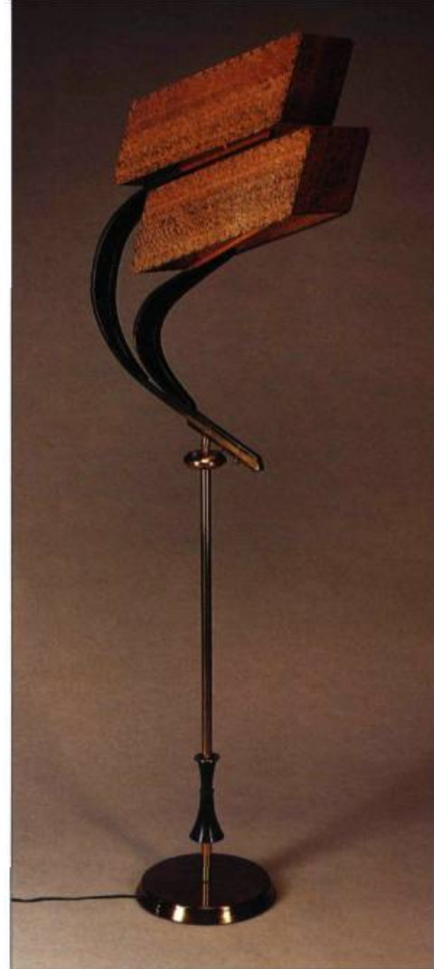
Cette lampe sur pied de style international datant des années 1960 possède un abat-jour translucide constitué de chlorure de polyvinyle chargé de fibre de verre.

Parmi les principaux agents responsables de la dégradation des plastiques, on retient l'oxygène, l'eau et la chaleur. L'oxygène et l'eau, respectivement responsables des réactions d'oxydation et d'hydrolyse, n'agissent pas seuls : ils ont besoin d'énergie pour s'enclencher. Cette énergie peut provenir de la chaleur, mais aussi du rayonnement, lumineux et ultraviolet, et même de stress physiques. Les tensions mécaniques sur un objet de plasti-