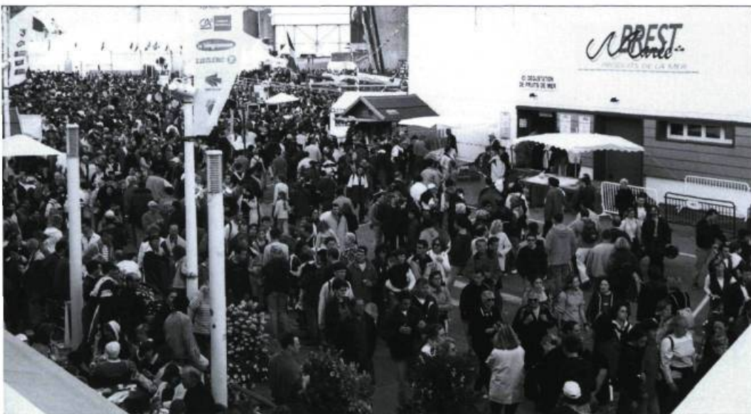
Le patrimoine maritime se vend bien en France. Les fêtes attirent des foules considérables d'amateurs et les partenaires commerciaux sont nombreux.

La Bretagne a réussi non seulement à sauvegarder mais aussi à réactualiser l'ensemble de son patrimoine maritime : gestes, paroles, objets, bateaux, lieux, côtes, bâtiments, etc. L'histoire de la naissance et de l'évolution de ces gigantesques fêtes de marins et de toutes leurs petites sœurs locales est porteuse d'enseignements.