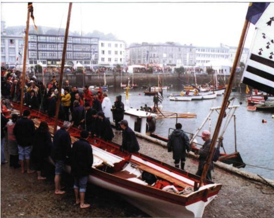
De jeunes Brestoïses inscrits à l'Atlantic Challenge s'apprêtent à remettre à l'eau la yole Fraternité bâtie en 1986 et radoubée pour le Défi jeunes marins 2000. L'actualisation du patrimoine est aussi confiée à la jeunesse.

Outre les paroles et les gestes de marins, les bateaux de bois y seront à l'honneur, symboles d'un patrimoine maritime qui refuse de capituler.