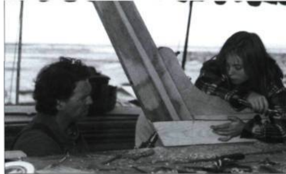
À l'été 1999, 10 jeunes Québécois ont participé au Défi jeunes marins 2000 à Saint-Joseph-de-la-Rive dans Charlevoix.

Enfin, ces festivals nous obligent, nous Québécois, à porter un regard moins modeste sur notre propre patrimoine maritime : nous qui sommes restés bouche bée devant les grands voiliers de 1984, un peu jaloux de la splendeur de ces « bateaux des autres » et amers de la disparition de cette portion de notre identité dans l'indifférence, nous devons désormais revoir sans gêne nos canots de chasse et nos voitures d'eau, redire nos « embarquements », nos « virages » et nos « radoubs », rechanter «...sur les bords du Saint-Laurent, pim panpan » et revisiter