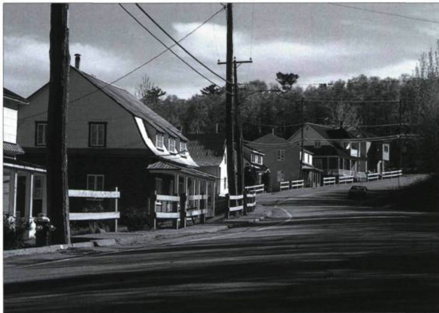
Le tissu urbain de Pointe-au-Pic est un amalgame de résidences permanentes et de résidences de villégiature. Dans cette zone, les maisons sont bâties en front de lot et le couvert végétal est à peu près inexistant.