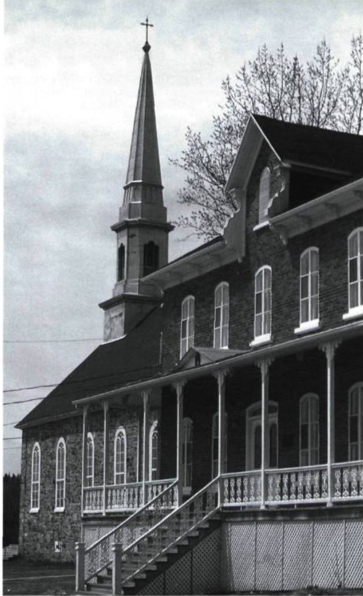
Dans le noyau villageois de Saint-Fidèle, on retrouve une concentration de bâtiments en bois d'avant 1940 et un ensemble religieux (presbytère, église et enclos paroissial) fort intéressants.