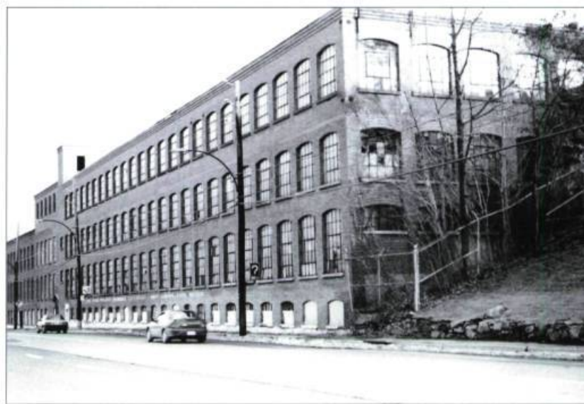
L'ancienne filature Elastic Web à Granby a été démolie, sans égard aux possibilités de recyclage de cet élément du patrimoine industriel de la ville.

Sans statut juridique, la Elastic Web ne bénéficiait d'aucune protection face au projet d'un promoteur d'utiliser ce site pour un bâtiment commercial neuf. Le CMSQ a tenté en vain d'amener les autorités publiques à empêcher cette démolition. Malheureusement, le patrimoine industriel ne bénéficie pas toujours de la reconnaissance qu'on accorde à d'autres types de bâtiments plus prestigieux, même si d'im-