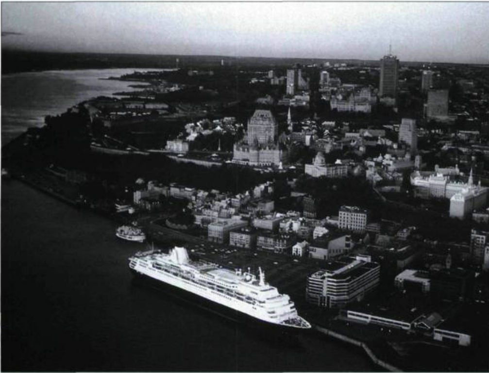
Vue aérienne des quais de la Pointe-à-Carcy qui accueillent les bateaux de croisière faisant escale à Québec.