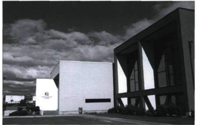
Le Centre de conservation du Québec, situé rue Sempie à Québec.

de 4000 projets dans des domaines aussi variés que l'art contemporain ou la conservation archéologique. Sa clientèle est très diversifiée: les musées, les municipalités, les fabriques et les communautés religieuses, les centres d'archives, les organismes liés au patrimoine... La conservation préventive constitue un axe majeur du travail des restaurateurs qui s'efforcent d'améliorer les conditions de préservation des œuvres d'art et des objets sur tout le territoire québécois. En septembre 1995, le Centre a été transformé en unité autonome de services du ministère de la Culture et des Communications.