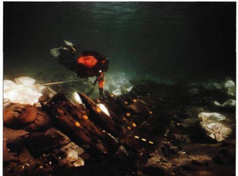
Le sauvetage de l'épave de la flotte de Phips aura permis d'associer la population locale à un formidable effort de conservation des vestiges.

La conservation et la restauration des vestiges vont requérir plusieurs années de travail. Les recherches des archéologues, des historiens et des spécialistes en culture matérielle permettront de mieux connaître l'expédition militaire de Phips contre Québec, la vie à bord du navire, l'architecture navale ainsi que la vie en Nouvelle-Angleterre à la fin du XVII e siècle. Ce projet est exemplaire en raison notamment de la mobilisation de la communauté locale, de l'engagement des bénévoles du Groupe de préservation des vestiges subaquatiques de Manicouagan (GPVSM) et de la concertation entre les divers paliers de décision.