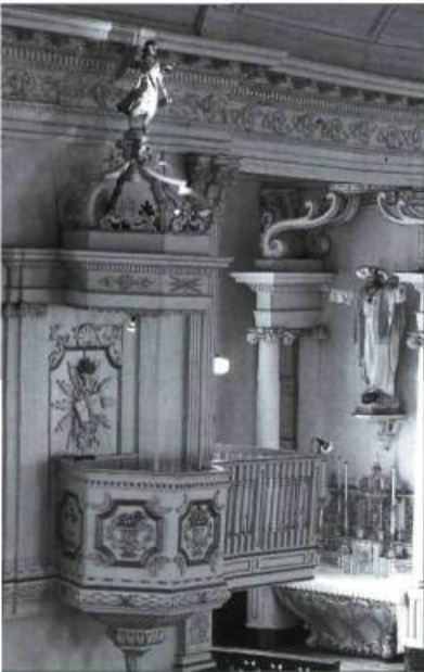
La chaise restaurée de l'église Saint-Léon-le-Grand.