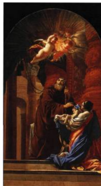
Un des joyaux de l'église de Saint-Henri de Lévis, le tableau de Simon Vouet « Saint François ressuscite un enfant mort ».

Grâce à la générosité de quelques paroissiens et avec l'aide du ministère de la Culture et des Communications, les quatre tableaux français de l'église Saint-Henri de Lévis sont maintenant restaurés: Simon Vouet (1590-1649), « Saint François ressuscite un enfant mort », Jean-Baptiste Corneille (1649-1695), « La résurrection », anonyme français du XVIII e siècle, « Le baptême de l'eunuque » et Daniel Hallé (1614-1675), « L'apparition de la Vierge et de l'Enfant Jésus à saint François et saint Antoine ». Les restaurateurs ont enlevé les vernis qui assombrissaient les couleurs et les surpeints qui cachaient souvent des parties de l'original. Le tableau de Simon Vouet a été exposé au Musée des beaux-arts de Montréal dans le cadre de l'exposition « Le grand siècle ».