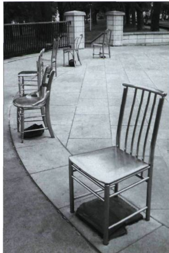
Michel Goulet, «Les leçons singulières, volet deux», 1991. Acier inoxydable, bronze et laiton. Belvédère Léo-Ayotte.

Le circuit du parc Lafontaine est l'un des circuits de découverte de l'art public à Montréal offerts par Cobalt Art Actuel.