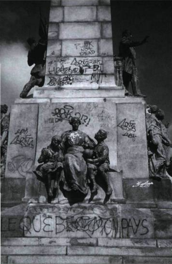
Le nettoyage fréquent des graffitis sur le monument à Sir Georges-Étienne Cartier, au pied du mont Royal, complique la conservation des bronzes et de la pierre.