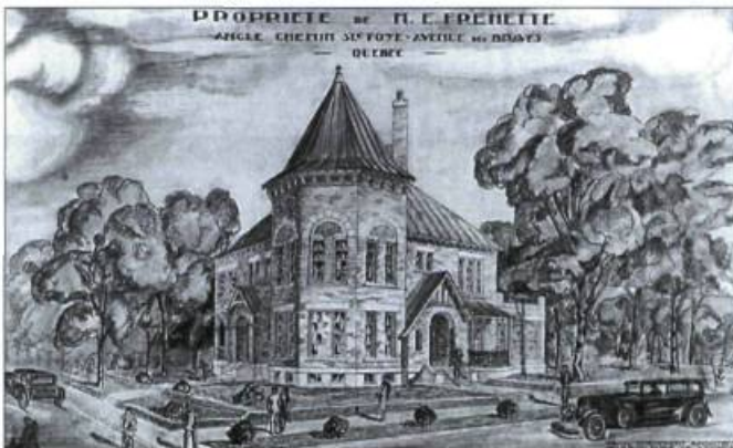
La maison Frenette.