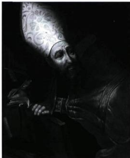
Œuvre d'un artiste inconnu réalisée au début du XIX e siècle, Saint Ambroise, avant et après les travaux de restauration effectués en 1997. Musée des Augustines de l'Hôtel-Dieu de Québec.