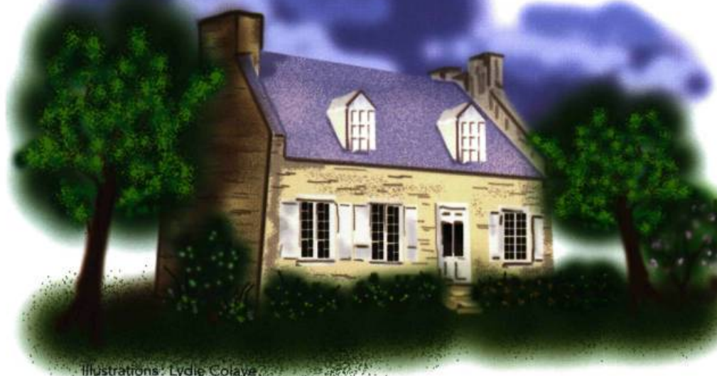
Illustrations : Lydie Colaye

Imaginons... Imaginons que Gédéon de Catalogne revient dans ce quartier qu'il a borné en 1698. Trois cents ans plus tard, partons avec cet arpenteur du roi à la découverte du cœur de la Côte-des-Neiges d'aujourd'hui.