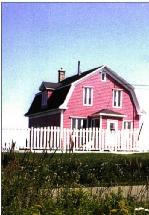
Une des maisons très colorées aux Îles-de-la-Madeleine.

la couleur d'un mur, on ajoutera des touches de sa complémentaire pour réaliser une harmonie de couleurs agréable à l'œil.