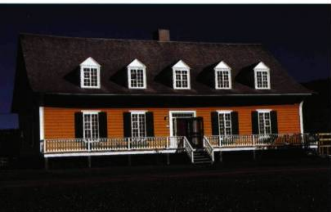
Manoir Le Bouthillier, construit vers 1840, à l'Anse-au-Griffon en Gaspésie.