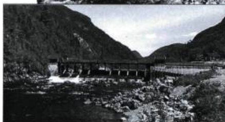
Le barrage des Hautes Gorges. En haut : après la réfection en 1997. En bas : en 1996.

Cette année marque les dix ans d'existence de la Réserve mondiale de la biosphère de Charlevoix dans laquelle se trouve le Parc régional des Hautes Gorges de la rivière Malbaie.