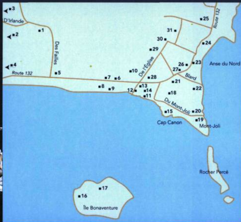
Île Bonaventure