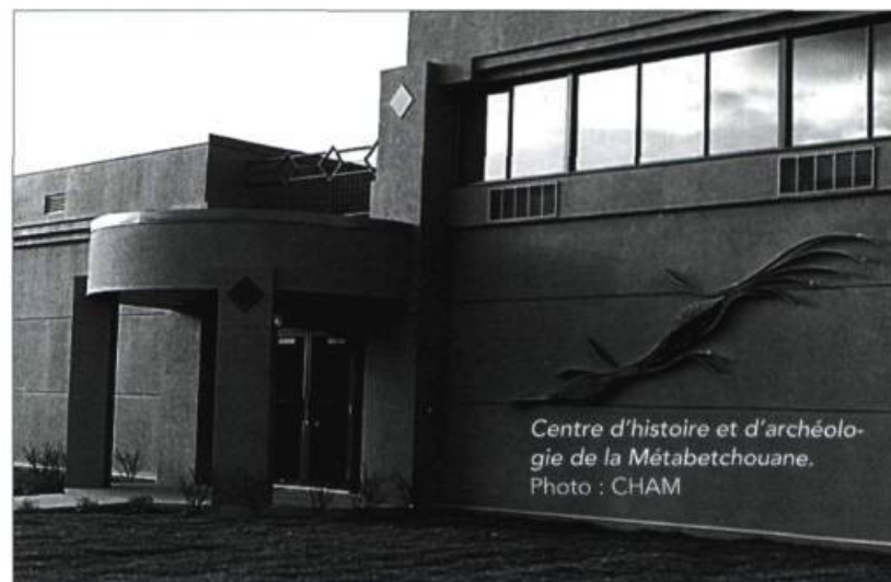
Centre d'histoire et d'archéologie de la Métabetchouane.