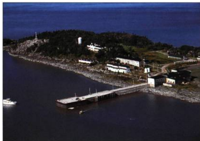
Vue générale de la Grosse-Île.

Cette année, contrairement aux années passées, le visiteur aura le droit de circuler à pied dans le secteur ouest de l'île. Il pourra se recueillir devant le cimetière des Irlandais, le plus important des trois cimetières de l'île (on évalue à 7480 le nombre de sépultures à Grosse-Île), et se rendre