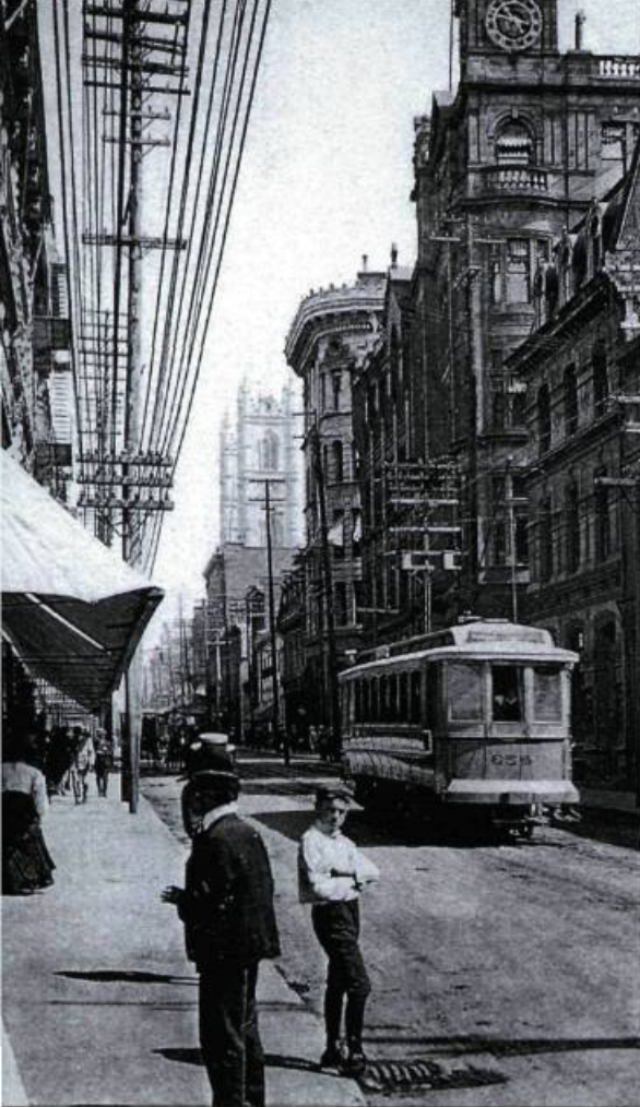
Le Vieux-Montréal a longtemps constitué le centre-ville d'une métropole au fort rayonnement continental.