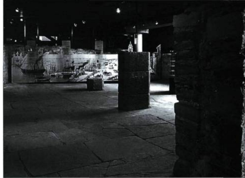
Au musée d'histoire et d'archéologie de Pointe-à-Callière, les nouvelles infrastructures laissent les vestiges dégagés. Ici, les vestiges architecturaux de l'édifice du Royal Insurance (1861).

À l'époque de restauration stylistique, plusieurs édifices restaient à l'état de « coquilles vides », aucune vocation n'ayant été planifiée dans le projet de restauration. Or, la seule restauration de l'enveloppe d'un