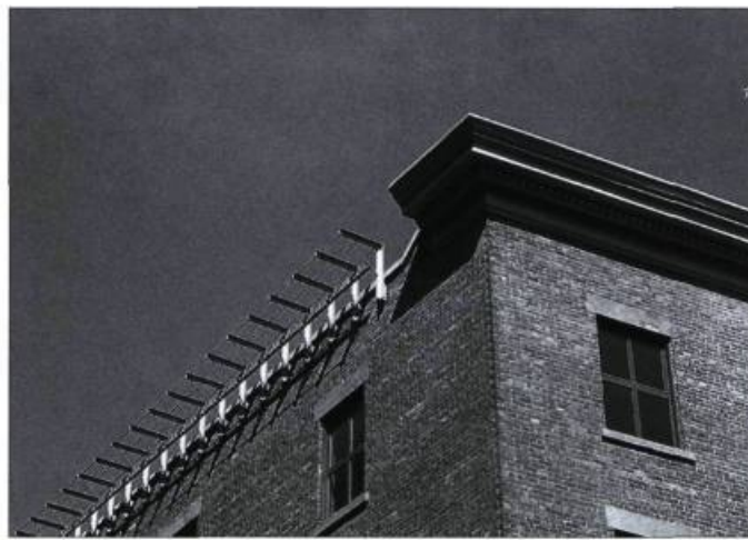
Le 110, rue Sainte-Thérèse, Montréal : pour bien représenter son époque, la nouvelle corniche interprète les formes de la corniche traditionnelle avec un langage et des matériaux contemporains.

Le projet de réanimation de l'entrepôt frigorifique du 110, rue Sainte-Thérèse, dans le Vieux-Montréal, ainsi que celui de l'ancienne boulangerie de l'île des Moulins à Terrebonne constituent des exemples dans le domaine. Une nouvelle vocation s'est intégrée à ces édifices industriels, tout en respectant leur caractère architectural, aussi simple soit-il. Les adjonctions réalisées dans le cadre de ces projets empruntent un langage contemporain qui s'inspire de la mémoire des lieux. Par exemple, le lien vertical qui unit l'ancienne boulangerie, devenue galerie d'art et salle de réunion, à son édifice voisin s'inspire de l'ancien monte-charge. Dans le cas de l'entrepôt du 110, rue Sainte-Thérèse, qui a aujourd'hui une vocation commerciale, institutionnelle et résidentielle, le traitement de la nouvelle corniche utilise un langage sans