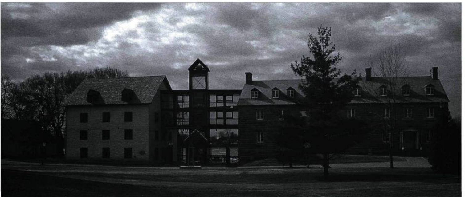
La boulangerie de l'île des Moulins de Terrebonne : la distribution des circulations s'inspire de la mémoire des lieux.

Pour réanimer de façon critique le patrimoine bâti, il faut aussi connaître son histoire et son évolution architecturale. Les recherches historiques servent de plus en plus à éclairer les décisions qui doivent être prises dans le processus de réanimation architecturale. La connaissance objective se base sur des photographies anciennes, des plans anciens, des manuscrits, etc. Les renseignements obtenus à partir de l'observation directe d'un édifice font aussi partie de ce type de connaissance. Une fois qu'il a regroupé ces informations, l'architecte-restaurateur doit les analyser. C'est l'étape de la connaissance critique. Ensuite vient celle de la restitution où, dans un processus de design, les problèmes liés à la réanimation doivent être résolus en considérant à la fois les besoins à satisfaire pour la