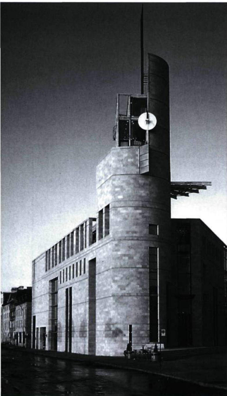
Musée d'histoire et d'archéologie de Pointe-à-Callière.

De la restauration stylistique à la réanimation architecturale, de Place-Royale au musée archéologique de Pointe-à-Callière, les préoccupations des défenseurs du patrimoine ont évolué au diapason des tendances internationales.