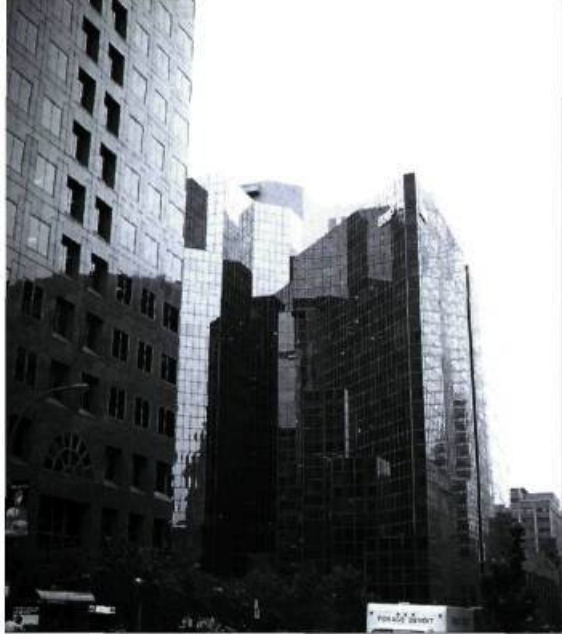
Les gratte-ciel de la quatrième génération s'inspirent du style international. On les qualifie souvent de Glass Boxes.