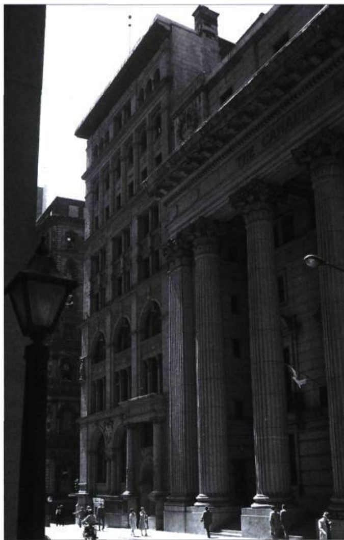
L'immeuble Canada Life, rue Saint-Jacques, est le premier gratte-ciel à ossature métallique. Il a été construit en 1900.

Les constructeurs montréalais ont profité des apports européens ainsi que des inventions et des perfectionnements technologiques américains pour construire les premiers gratte-ciel. La distribution du courrier par pneumatique, le système de ventilation et de chauffage de même que le contrôle de la lumière par l'éclairage électrique ont permis d'assurer aux occupants plus de confort et de bonnes conditions d'hygiène et de sécurité.